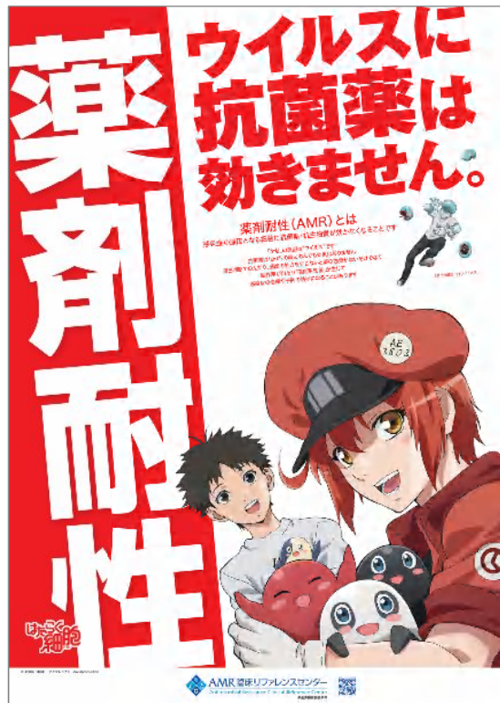
ポスター (B3 364×515mm)

毎年好評のTVアニメ「はたらく細胞」を使ったAMR対策キャンペーン啓発資材です。 薬局へ来局された方へ配布していただき、薬剤耐性(AMR)の啓発にお役立てください。 啓発資材配布にご協力いただける方は、↓コチラのURL・QRコードからお申し込みください。