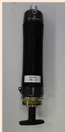
気体採取器(ガステック) (GV-110S)