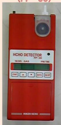
ホルムアルデヒド・二酸化窒素 両用検知器ホルアルデッカー (FP-30)