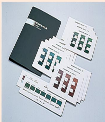
黒板検査用色票 (明度・照度票)