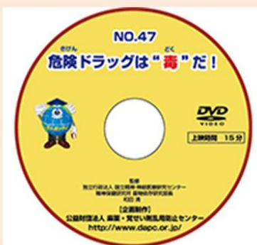
危険ドラッグは“毒”だ！ DVD