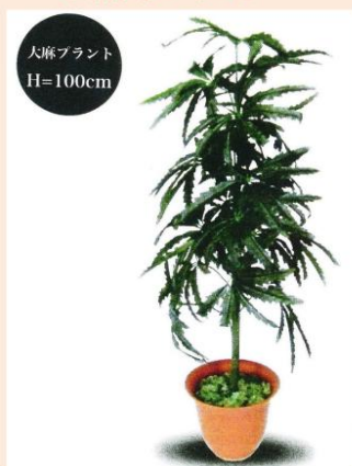
薬物草造花 大麻草プラント