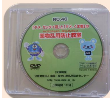
「ダメ。ゼッタイ君」と「ダメ。くま君」の薬物乱用防止教室DVD