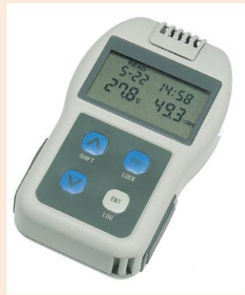
ポケット温湿度計 (HN-CHNR)