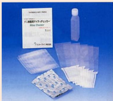
マイティチェッカー (屋内塵性ダニ簡易検査キット) (販売)