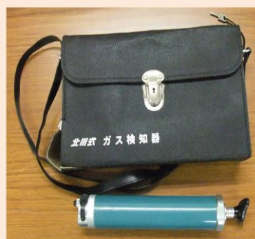
北川式検知器(光明) (AP-400)