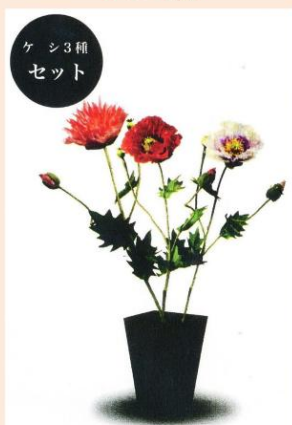
薬物草造花 ケシ3種