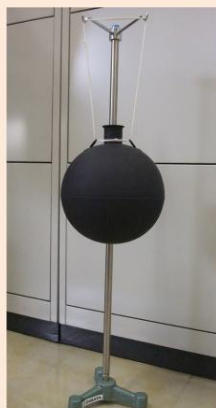
グローブサーモメーター (黒球・架台付)